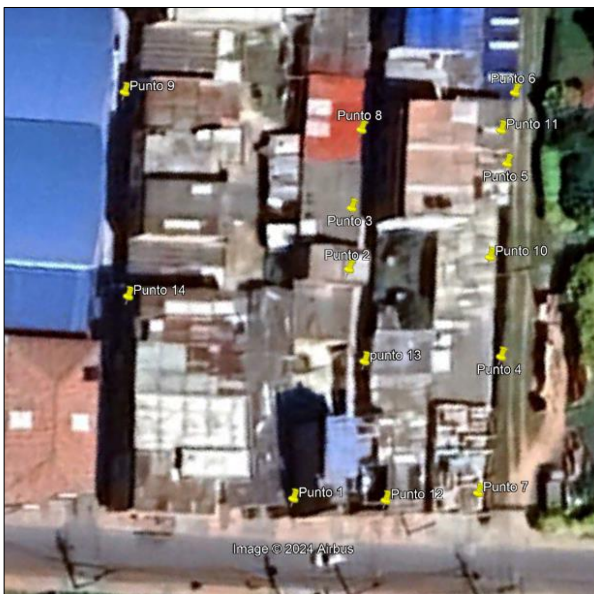
Ilustración 1. Visitas realizadas

Teniendo en cuenta que ante el municipio de Funza se interpuso queja por disposición inadecuada de residuos, personal adscrito a la Secretaría de Ambiente y Bienestar Animal realizó catorce (14) visitas de control y vigilancia, los días 16, 20 y 27 de agosto (Ver ilustración 1) en el barrio Nuevo México, con el fin de dar a conocer a doce viviendas y dos establecimientos comerciales; los comportamientos contrarios a la limpieza y recolección de residuos, así como las medidas correctivas a aplicar en caso de incurrir en alguno de dichos comportamientos.