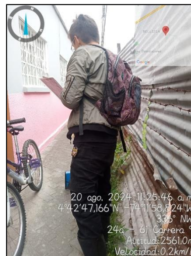
Ilustración 10. Visita de control y vigilancia Sector residencial