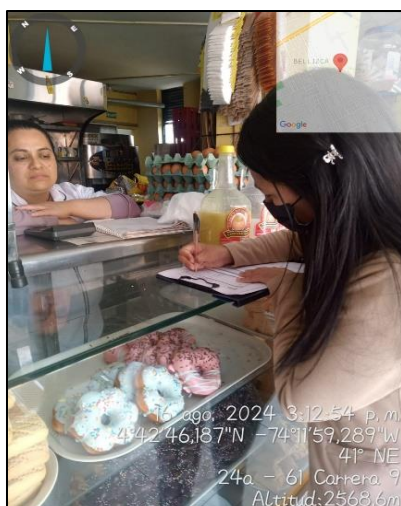
Ilustración 3. Visita de control y vigilancia Sector comercial