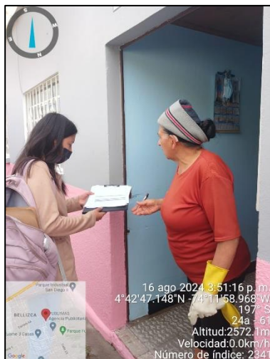
Ilustración 5. Visita de control y Vigilancia sector residencial

C.P.250020 Tel. +57(1) 823 40 70 823 40 71 / 823 40 73 Fax. + 57(1) 825 76 20 Dir. Cra. 14 No. 13-05