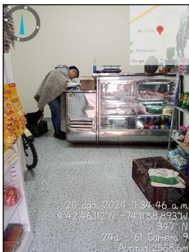
Ilustración 8. Visita de control y Vigilancia sector comercial