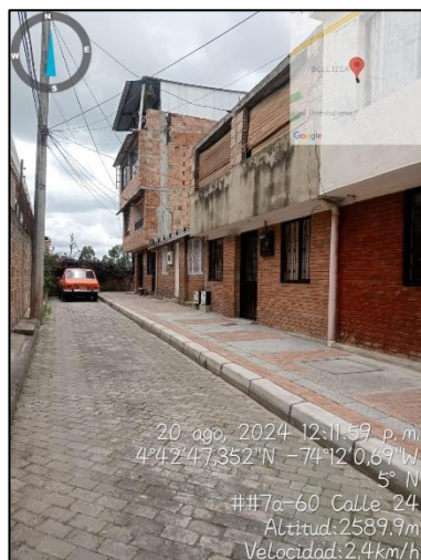
Ilustración 9. Visita de control y vigilancia Sector residencial