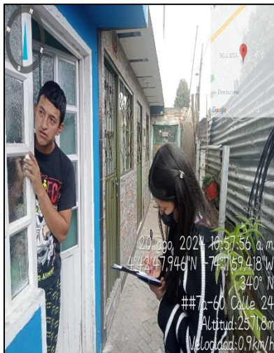
Ilustración 6. Visita de control y vigilancia Sector residencial