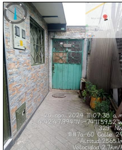
Ilustración 7. Visita de control y vigilancia Sector residencial