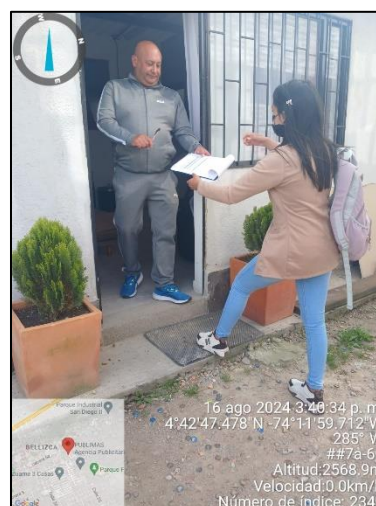
Ilustración 4. Visita de control y vigilancia Sector residencial